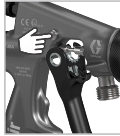
无需工具拆卸扳机