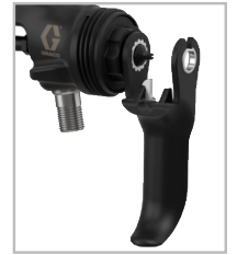
内置流体套筒拆卸功能