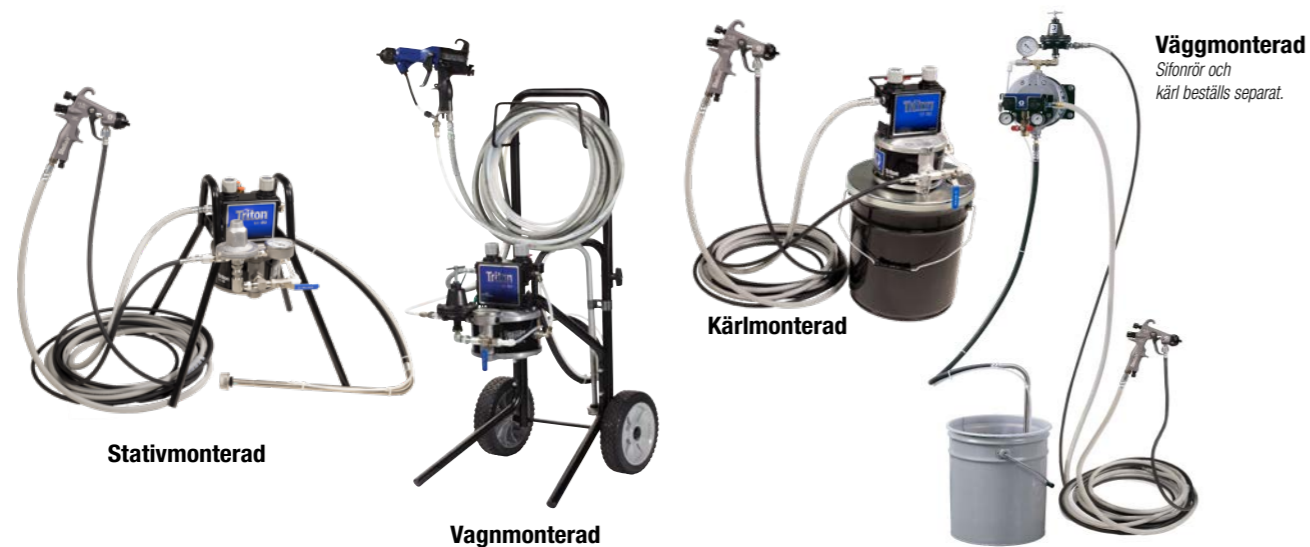
Vägghmonterad Sifonrör och kärll beställs separat.