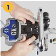
1 Kontrol kapağını kaydırın ve kaldırarak açın