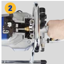
2 Pompa grubunu çıkarın