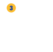
3 Utilisez un raccord hexagonal à châssis pour desserrer la pompe et retirez la cartouche