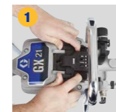
1 Faites glisser et soulevez la porte d'accès