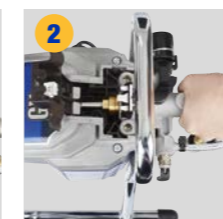
2 Retirez la section de la pompe