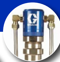
DUTYMAX™ GH300 HD STANDARD