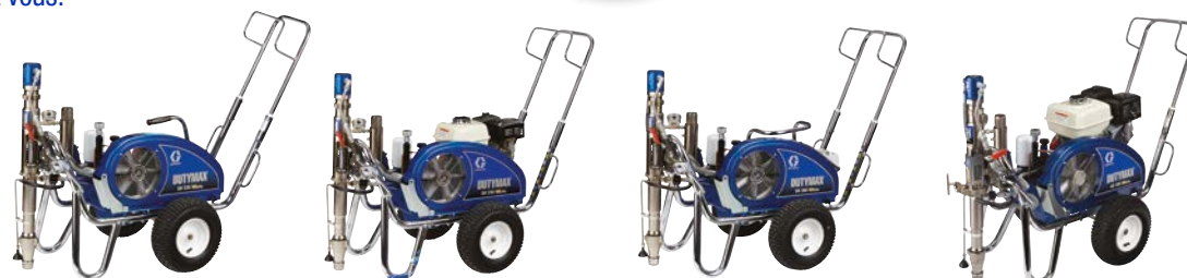
DUTYMAX™ EH230 HD STANDARD