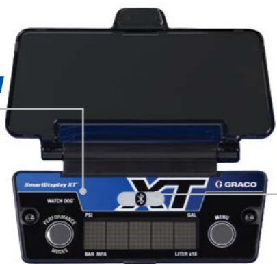
SmartDisplay XT 20B432