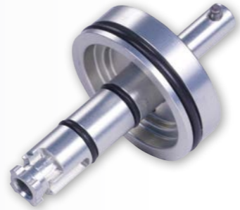
AP Hava Pistonu