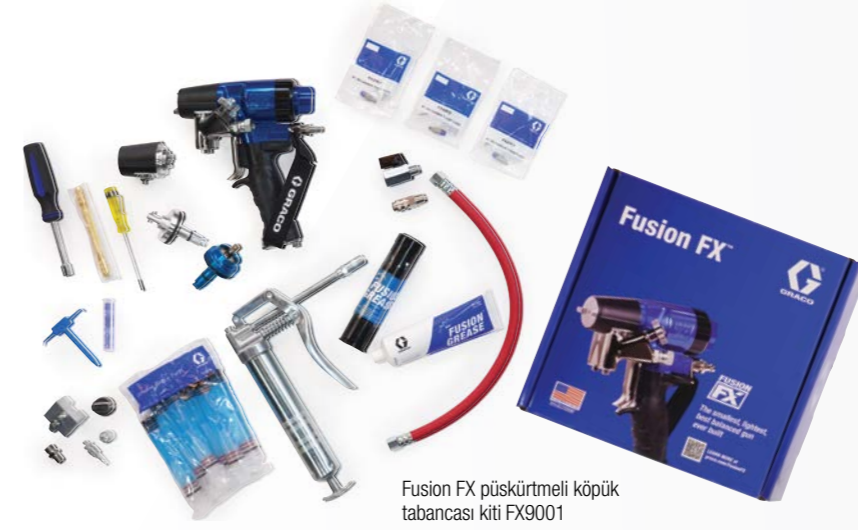
Fusion FX püskürtmeli köpük tabancası kiti FX9001