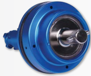
CS Hava Pistonu