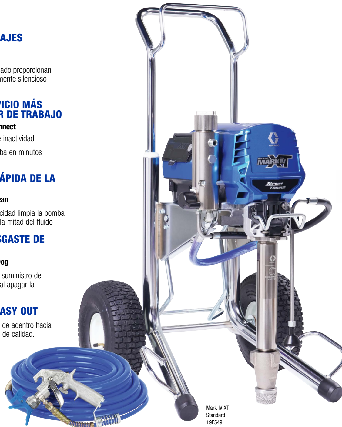
Mark IV XT Standard 19F549