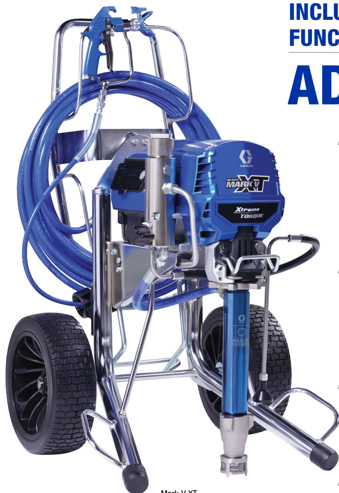
Mark V XT ProContractor 19F552