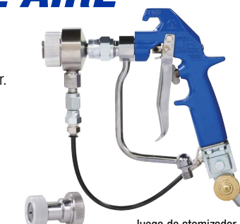
Juego de atomizador de aire 18H255