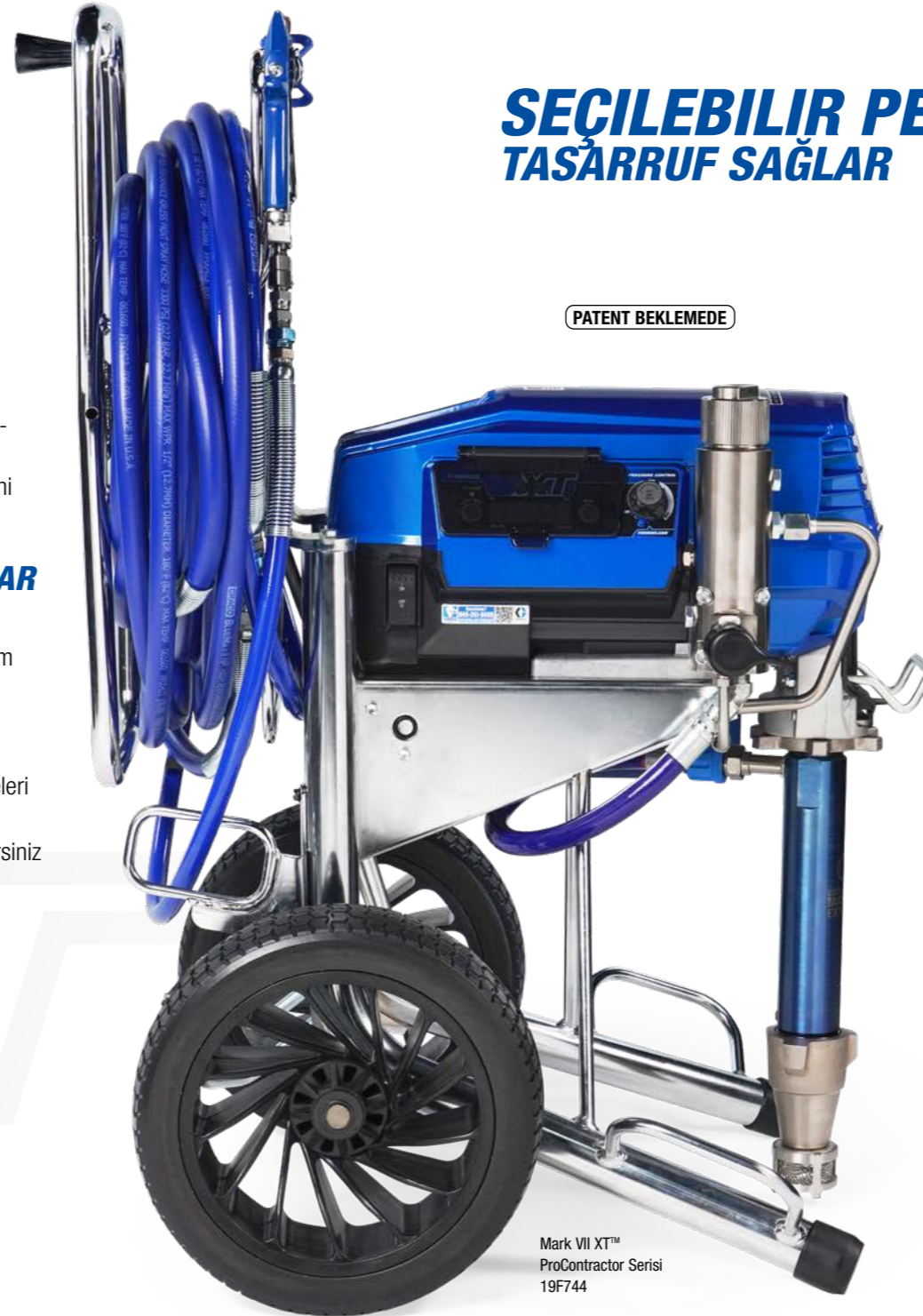
Mark VII XT™ ProContractor Serisi 19F744