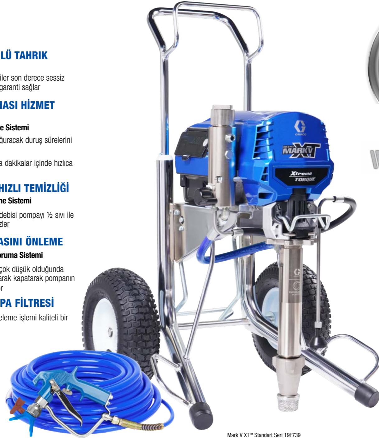
Mark V XT™ Standart Seri 19F739