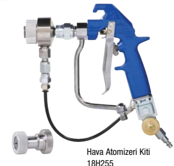
Hava Atomizeri Kiti 18H255

• Dairesel tabanca hareketi ile ilişkili yorgunlukları ortadan kaldırır.