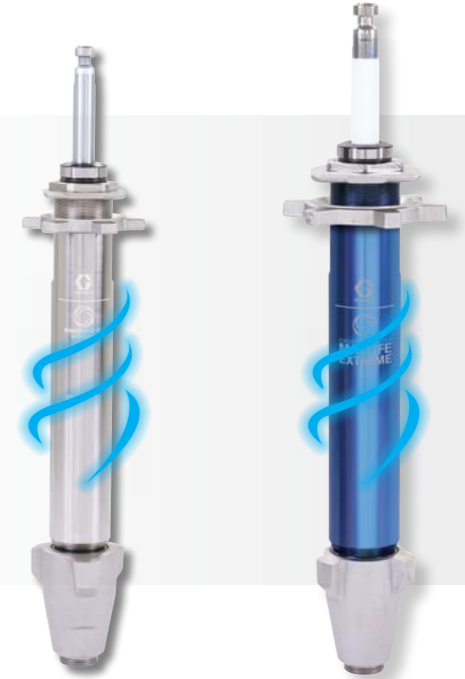
Endurance Vortex Chromex™ Pompa

Rakip pompalara kıyasla 3 kat daha uzun bir kullanım ömrüne sahiptir