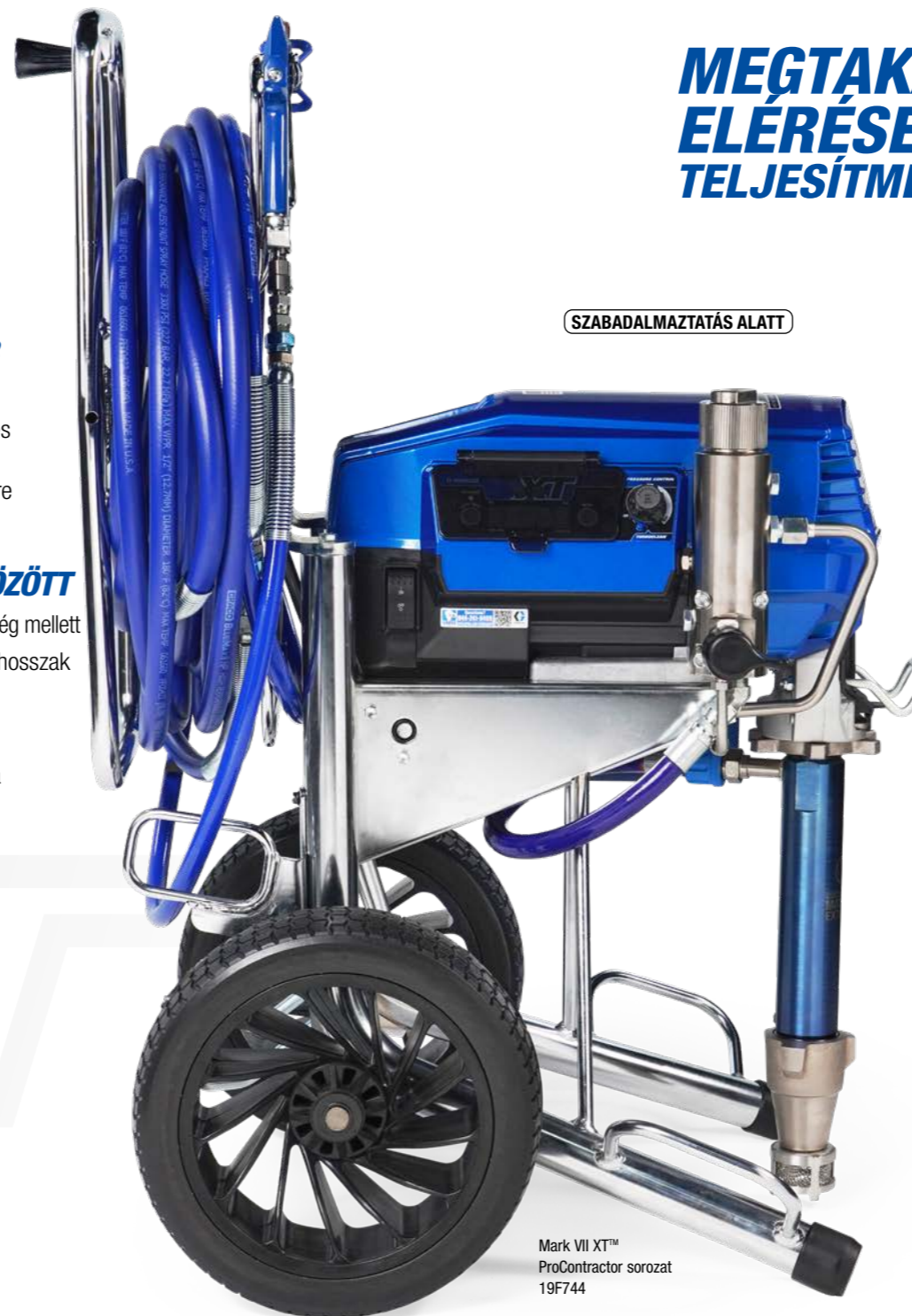
Mark VII XT™ ProContractor sorozat 19F744