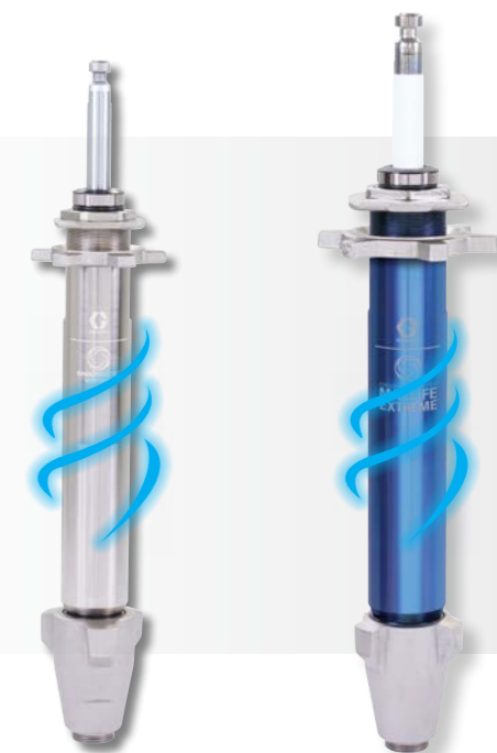
Endurance Vortex Chromex™ szivattyú

Háromszor hosszabb élettartam, mint a konkurens szivattyúknál