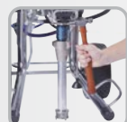
Lazítsa meg a szorítóanyát.