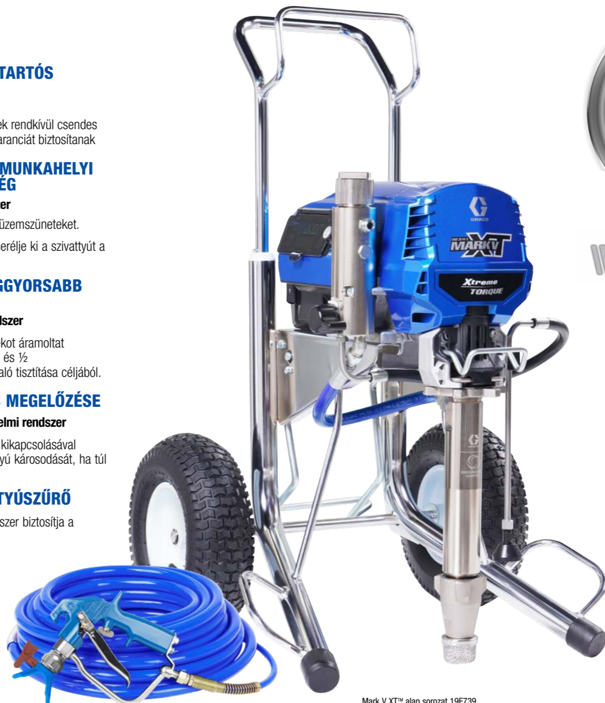
Mark V XT™ alap sorozat 19F739