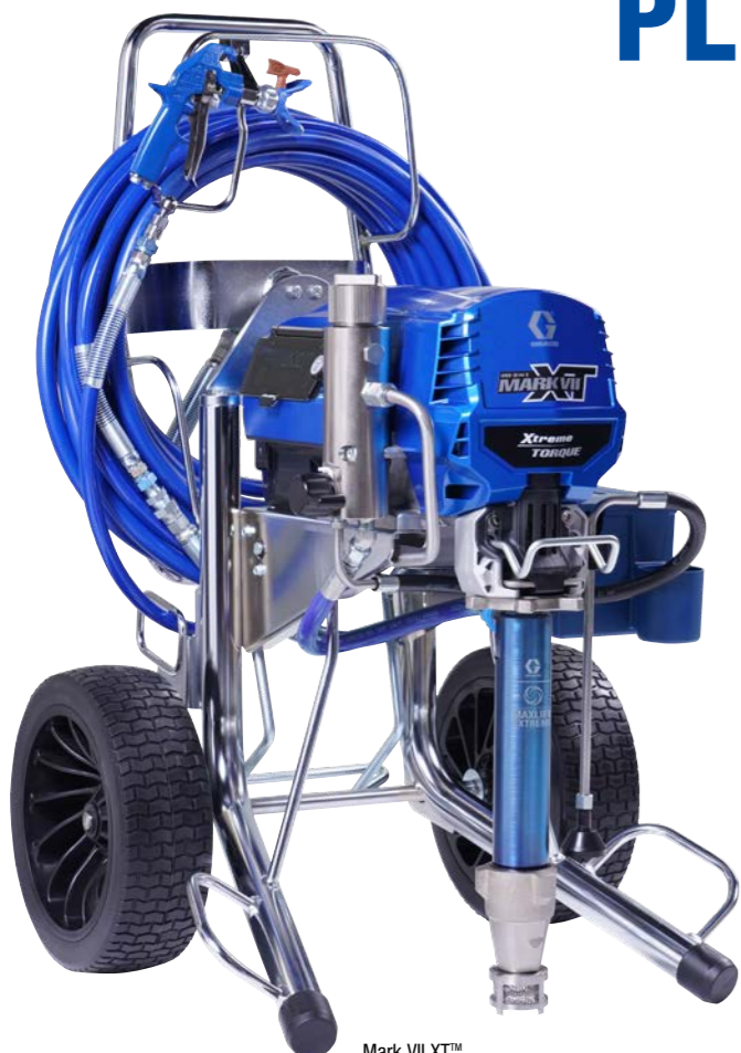
Mark VII XT™ ProContractor sorozat 19F744