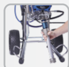
Nyissa ki a tartórészt és a szivattyú leszerelése