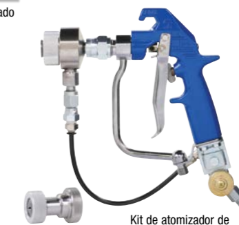
Kit de atomizador de aire 18H255