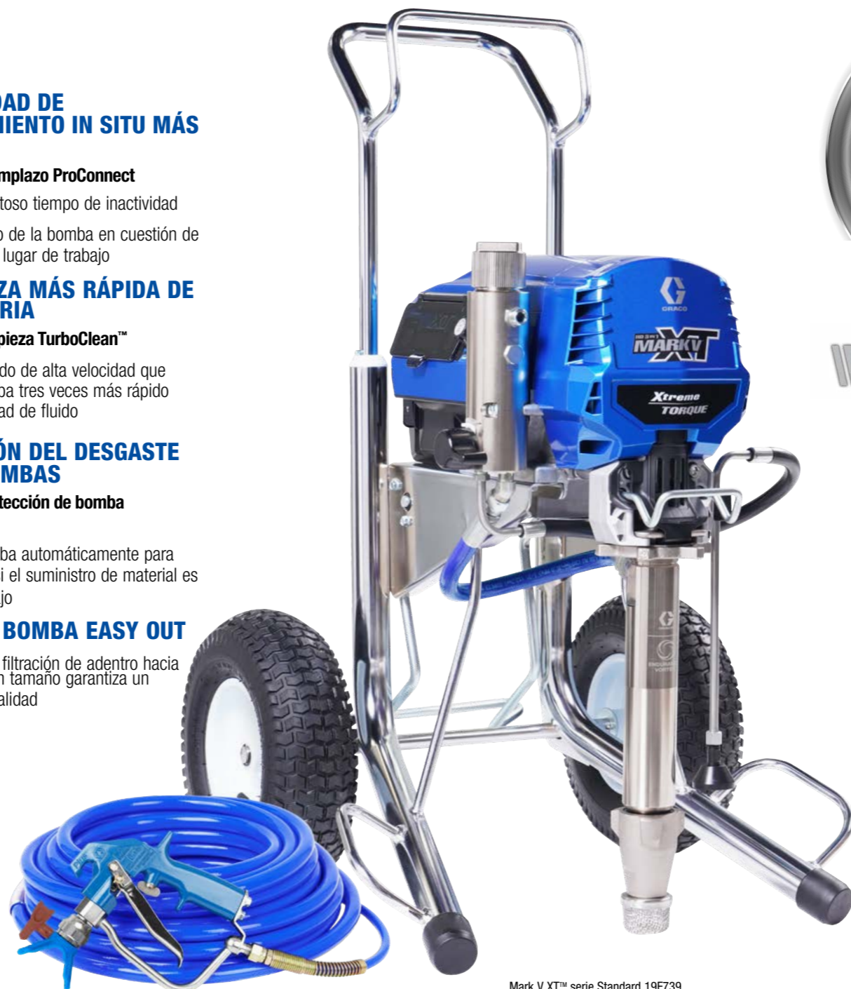
Mark V XT™ serie Standard 19F739