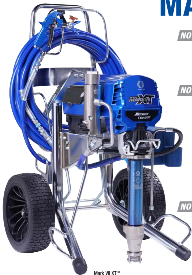
Mark VII XT™ Serie ProContractor 19F744

NOVEDAD MAYOR VIDA ÚTIL DE LA BOMBA Bombas de pistón Endurance Vortex MaxLife Extreme