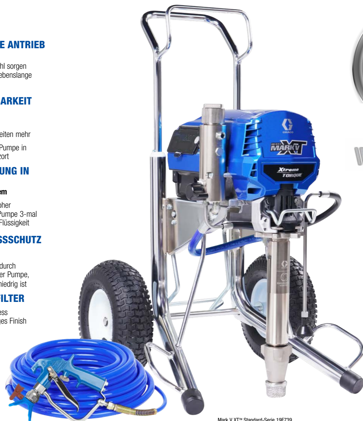
Mark V XT™ Standard-Serie 19F739