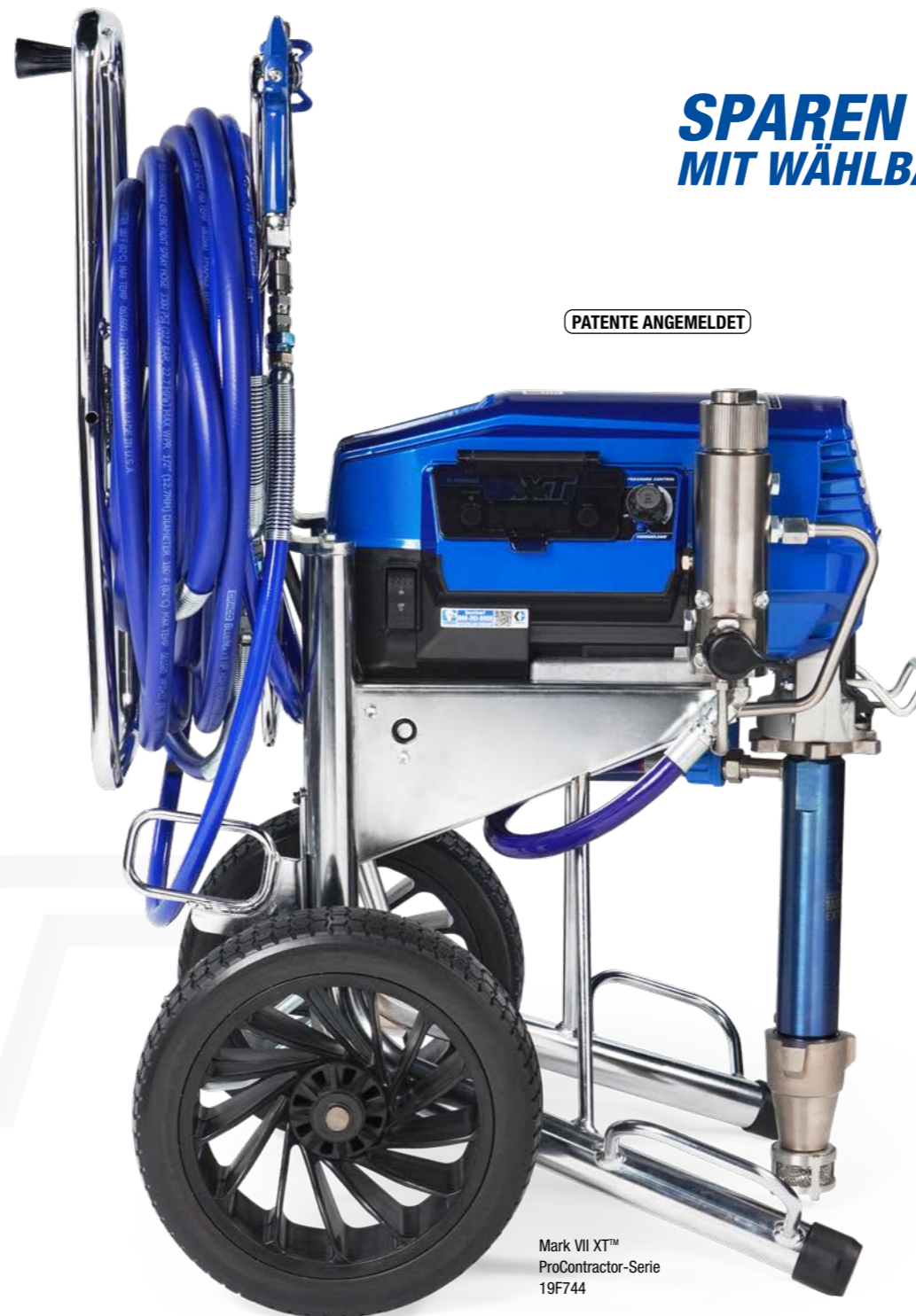
Mark VII XT™ ProContractor-Serie 19F744