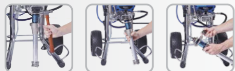
Die Spannmutter lösen