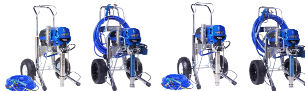
Mark VII XT™ ProContractor-Serie 19F744

BAHNBRECHENDE FUNKTIONEN IN DER GESAMTEN XT-REIHE