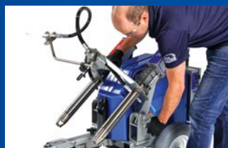
2) Kantel de pompeenheid terug