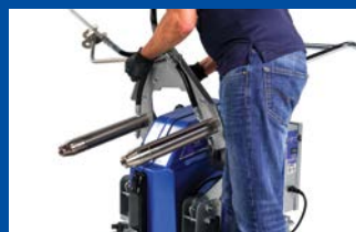
3) Verwijder het ProConnect-pompsysteem