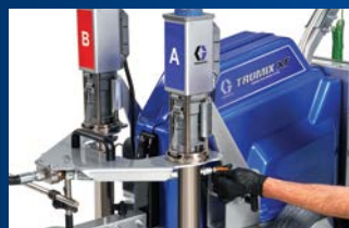
1) Verwijder de borgklemmen en drukomzetteraansluitingen