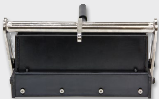
SmartDie II 4 x 4 x 4 in