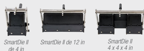
SmartDie II de 4 in