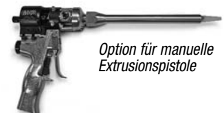
Option für manuelle Extrusionspistole