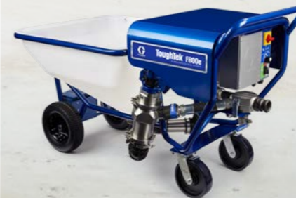
BOMBA DE PISTÓN

La bomba ToughTek F800e, diseñada con la tecnología de bomba de pistón de patente en trámite de Graco y un eficiente motor de transmisión directa, pulveriza hasta 40 bolsas por hora mientras está enchufada a un enchufe estándar de 240 V y 30 A. Reduzca el mantenimiento mientras obtiene una mayor vida útil de los sellos de la bomba de pistón (en comparación con las bombas del estator/rotor) con esta bomba de alto rendimiento.