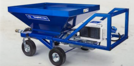
BOMBA DE ESTATOR/ROTOR

La tecnología simple de una bomba de estator/rotor es perfecta para contratistas que buscan una bomba básica que sea fácil de limpiar y reparar. La bomba P30X cuenta con una tolva de 60 galones (227 litros) y ofrece un rendimiento superior a partir de una bomba de estator/rotor.