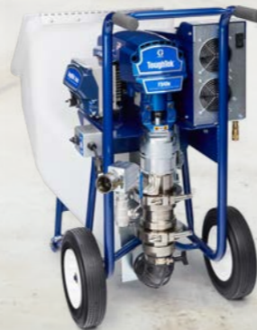
BOMBA DE PISTÓN

Con su tamaño compacto y portátil, la bomba F340e es ideal para trabajos que pulverizan hasta 100 bolsas por día. Esta bomba ofrece un rendimiento de pulverización impresionante gracias a su motor eléctrico de transmisión directa de bajo consumo y los componentes de bomba de alto rendimiento.